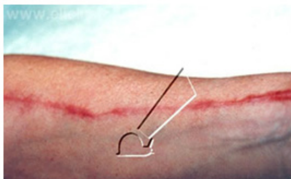
Enero 1994 Cicatriz debida a la extirpación de la arteria radial por trasplante coronario.