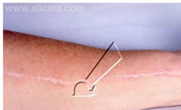
Noviembre 1994 Cicatriz plana, se presenta con una coloración similar a la de la piel.