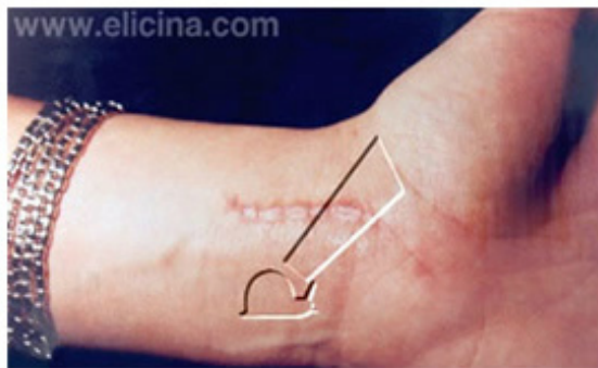
Agosto 1994 Cicatriz debida a la operación de síndrome de túnel carpiano.